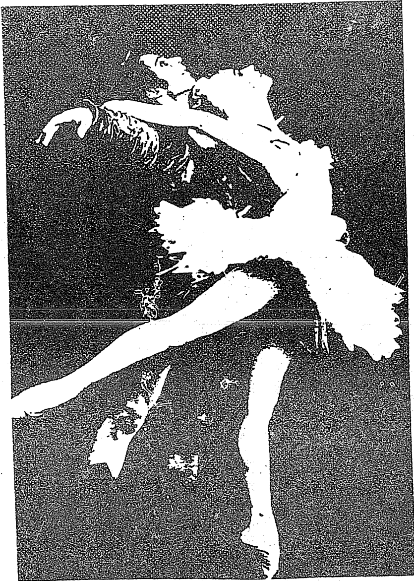
Los movimientos corporales forman parte también de una semiótica gestual.

no se inició hasta años después de la Segunda Guerra Mundial. Esto no significa que no encontremos ya alguna referencia entre los antiguos griegos o chinos, o que en trabajos sobre danza, teatro o liturgia no haya manifestaciones interesantes sobre la consideración de los aspectos no verbales. Más adelante nos referiremos, por ejemplo, al caso de Hipócrates: la descripción que nos hace del rostro de un moribundo es una muestra excelente de lo que estamos tratando. Si damos una ojeada a la historia de la medicina, de la psicología, de la filosofía, de la antropología o de la lingüística siempre encontraremos algún aspecto relacionado con los signos no verbales, pero esto no significa de ningún modo que la comunicación no verbal, como tal disciplina, formara parte de las investigaciones tradicionales de alguna de estas ciencias.