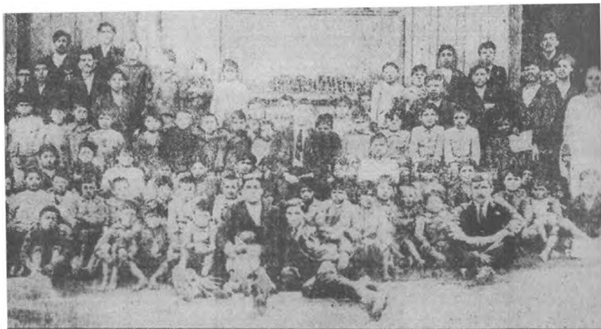
Escuela de Puente Alto, foto de La Federación Obrera , 1922

La función estaría a cargo del Cuadro Luz del Porvenir 111 .