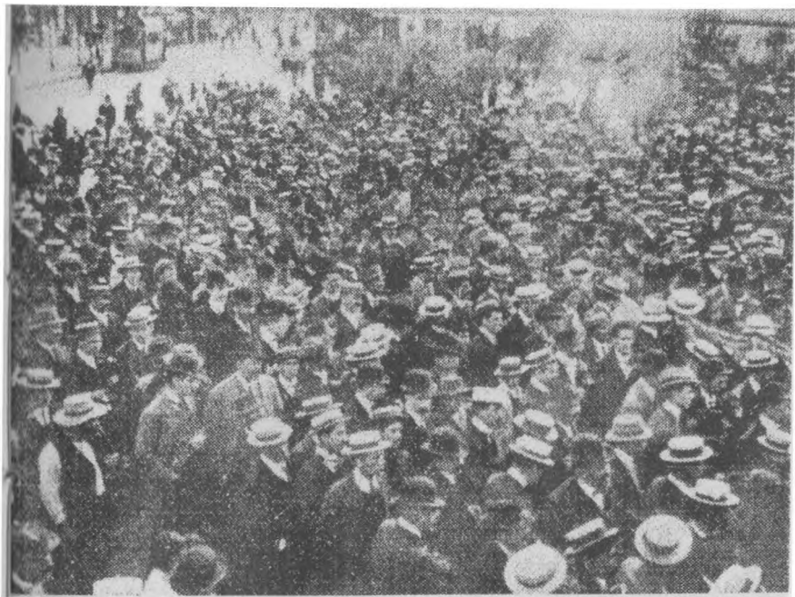
Meeting pro Ferrer en Santiago, en Zig-Zag, n° 244, 23 de octubre 1909