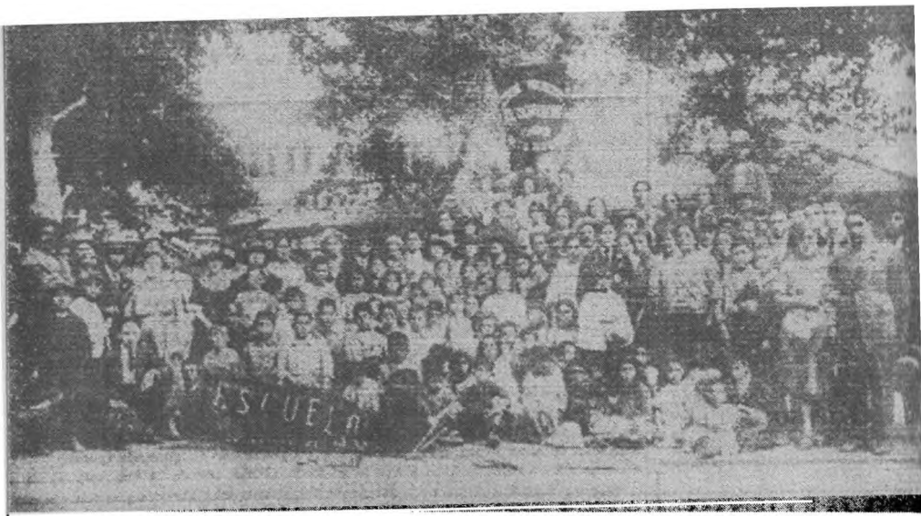
Escuela de Peñaflor, hacia 1925, bautizada como “Luís Emilio Recabarren”