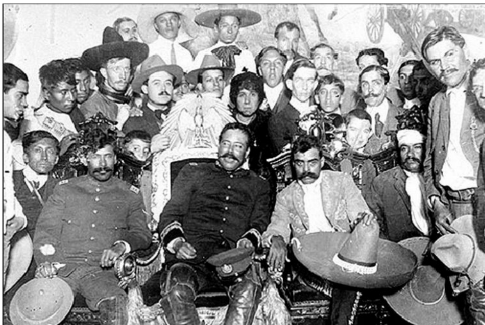
Imagen 1. Pancho Villa y Emiliano Zapata ocupando el Palacio Nacional (casa de gobierno) en la ciudad de México (1914)

Para retener el apoyo popular, por su parte, Carranza formuló una serie de medidas concretas que iban en el sentido de la reforma agraria: la necesidad de formar pequeñas propiedades, restituir las tierras que habían sido usurpadas a los pueblos y comunidades. También buscó el apoyo de los sectores obreros urbanos, proponiendo medidas que mejoraban las condiciones de los asalariados industriales. Como en otras regiones de América Latina, el anarquismo sindical había tenido un papel muy importante en la organización de un movimiento obrero en la región central del país, especialmente en la ciudad de México.